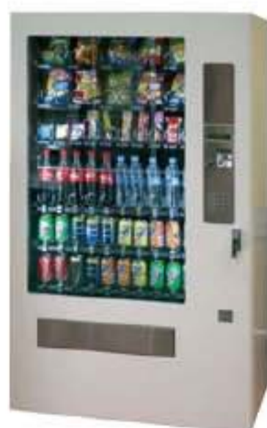
Snacks y bebidas