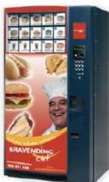
Hamburguesas, sandwich y bocadillos calientes