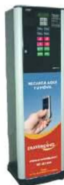
Recargas de telefonía móvil y tarjetas internacionales